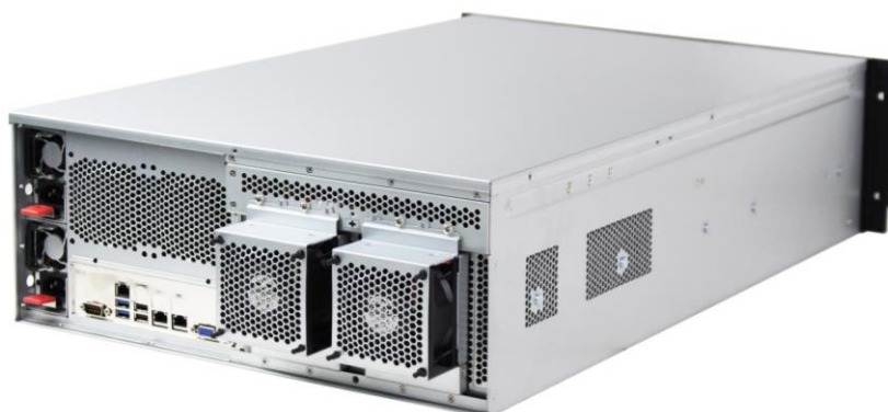
5 卡 GPU 服务器机箱后视图