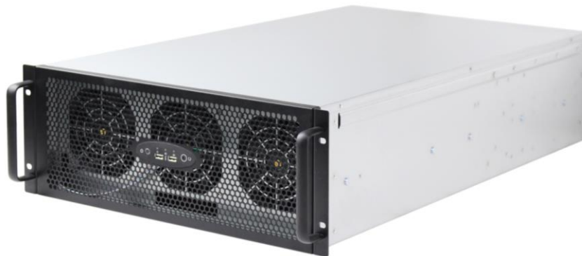
5 卡 GPU 服务器机箱正视图