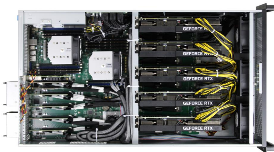
5 卡 GPU 服务器机箱俯视图